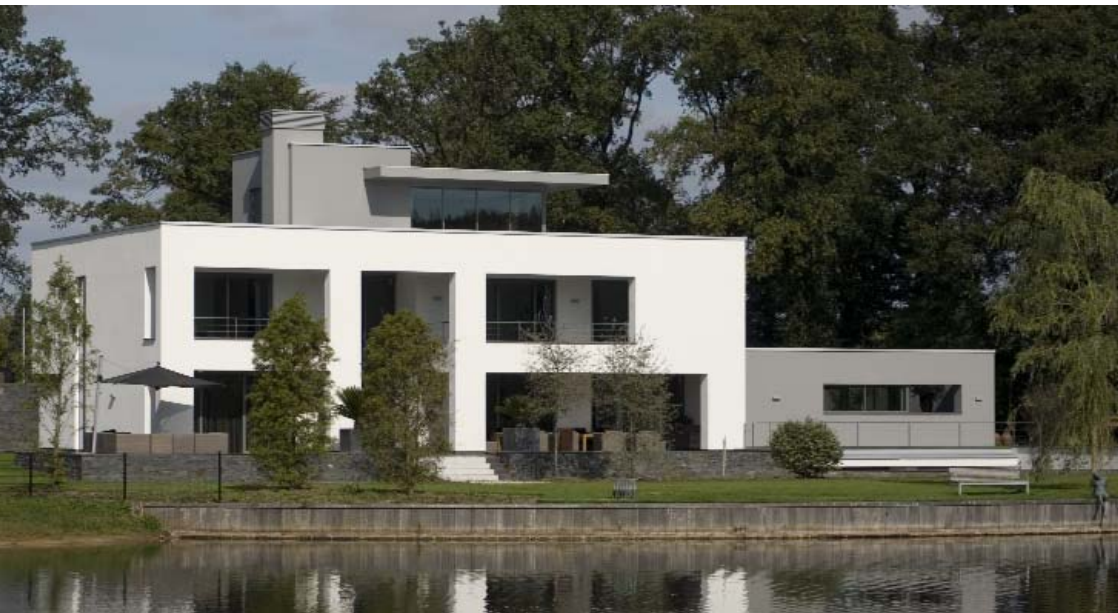
Große, tief eingeschnittene Öffnungen bestimmen die Fassade des weiß verputzten Kubus. Das Staffelgeschoss und der eingeschossige Seitenflügel sind dagegen in einem dunkleren Grauton gehalten.