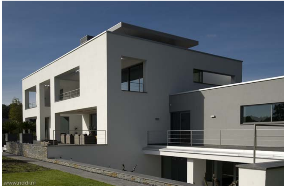
Durch die Tiefe von zweieinhalb Metern bilden die Loggien eine großzügige Erweiterung der Wohnräume. Im Obergeschoss erhalten sie zusätzlich Licht durch bewegliche Metalllamellen, die dort den Dachabschluss bilden und sich den Lichtgegebenheiten anpassen lassen.