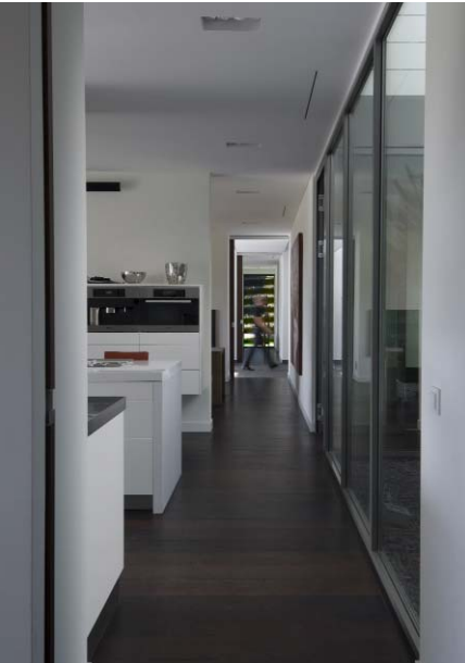
Lange Flure strukturieren den offenen Grundriss der Villa.